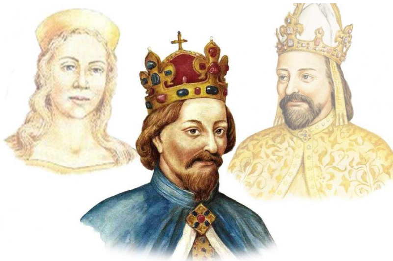
Portrét Jana Lucemburského, v pozadí matka Anna Svidnická a otec Karel IV.